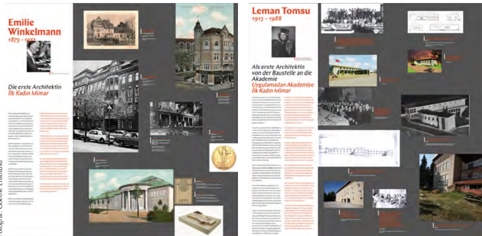
3. "Kadın Mimar: Türkiye ve Almanya'da Mimarlık Mesleğinde Kadınlar" başlıklı sergiden bir kare

miştir. Cumhuriyet sonrası modern mimarlığın gelişim sürecinin aktarımında yaygın olarak kullanılan yaklaşık 9-10 yıllık aralıklardaki tarihsel bölümlenme, siyasi ve sosyo-ekonomik konjonktürdeki değişimlere paralel olarak mimarlık ortamındaki değişimleri okumak ve anlamlandırmak açısından faydalı görülmektedir. Dolayısıyla, kuşaklar arasındaki geçişte ilk mezunun verildiği 1934-1950, 1950-1980, 1980 ve sonrası olmak üzere üç tarihsel bölümlenmenin yanı sıra mimari tasarım ve