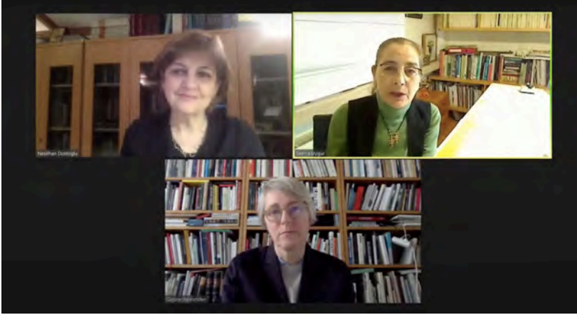
5. 6 Mayıs 2021 tarihinde Goethe Enstitüsü resmi YouTube kanalı üzerinden çevrimiçi olarak gerçekleşen "Söyleşi: Mimarlık Alanındaki Kadınlar - Mesleki Pratiğe Bir Bakış" başlıklı etkinlikten bir kare

uygulama yapmış olmalarının öncelikli seçim kriteri olarak dikkate alınmasıyla bir seçki oluşturulmuştur. Erkaslan'ın altını çizdiği üzere, her ne kadar Türkiye'de mimarlık eğitiminin ve meslek ortamının kapılarının kadınlara açılması, kadınlar tarafından verilmiş özerk bir mücadeleden ziyade sunulan hukuki ve toplumsal haklar çerçevesinde devletin desteğini arkalarına alarak gerçekleşmiş olsa da erkek egemen bir meslekte var olmak ve ilerlemek için verdikleri mücadele göz ardı edilmemeli, aksine daha çok bilinmeli ve tartışılmalıdır. Bu bağlamda, Türkiye modern mimarlığından kadınlara dair bilgi ve belgelerin kamuoyuyla buluşturulması açısından sınırlı da olsa bu serginin yaptığı başlangıcın önemini vurgulamıştır. 5