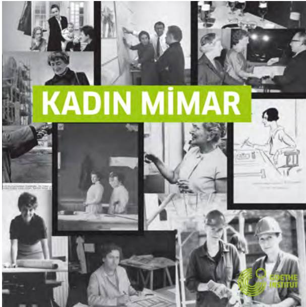
1. Etkinlik afişi

Tarihte mimarların -kadın ya da erkek- meslek ortamındaki cinsiyete dayalı eşitsiz duruma ilişkin bir cevap arayışının 19. yüzyıla kadar geriye gittiği bilinmektedir. 1