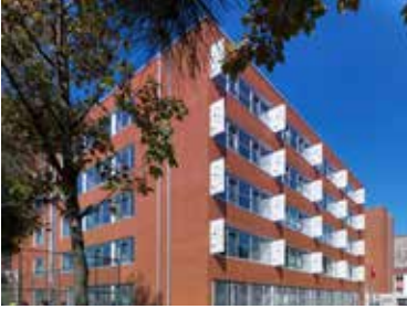
Kağıthane Ziya Paşa İÖO

Okul yapıları, çocukların ilk kez toplumsal mekân ile yüzleştikleri alandır. Bu nedenle hepimizin hayatında toplumla ilk kaynaşma ve yapısal çevreden öğrenme deneyimi açısından oldukça önemlidir. Ülkemizde uzun yıllardır uygulanan tek tip okullar aynı zihniyette beyinler yetiştirme düşüncesinin mekânsal alt yapısını oluşturmaktadır. Okulların çocuklara özgürlük alanları yaratır nitelikte olması gerekmektedir. Tasarımlarda buna gayret edilmiştir.