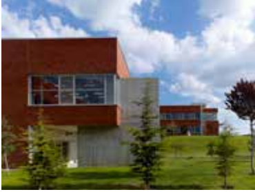
TED Ankara Koleji

Bu okulların yeniden yapım nedeni, sağlamlık ve depreme karşı dayanıklılık olmasına karşın, ayrıca bu konu mimarinin de olmazsa olmazlarından bir tanesidir.