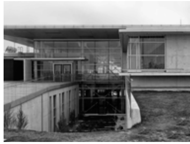
TED Ankara Koleji Mezunlar Derneği

Devlet okulları, tip proje olmanın dışına taşıma gayretimizle mevcut şartlarda bu şekilde yorumlanmıştır. Bu ürünler ile bir kırılma, aynı zamanda başlangıç noktası yaratılmış olduğunu umulmaktadır. Bundan sonra yapılacak eğitim, yapılarında bu başlangıç nok-