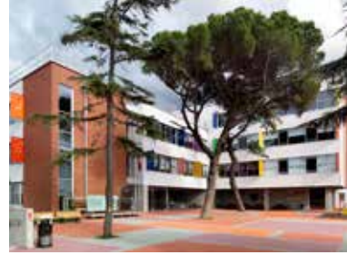
Üsküdar Sultantepe İÖO

Herkesin okul anıları vardır, ancak bu anılar mekânlar ile anımsanırlar. Okul anılarımızda yer eden mekânların bıraktığı izlenimler çevre duyarlılığımızı, şehirlerimizin daha yaşanır olmasını da sağlayacak altyapılardır. Bu nedenle, bu sıra dışı mimariye sahip okullarda okuyan öğrencilerin başka mekânlara daha eleştirel bakabileceklerini ve daha iyisini talep edeceklerini öngörülmektedir. Okul mekânlarını kullananların her sene % 25 artıyor olması, bu mekânların kullanıcılar üzerindeki etkisinin çoğalarak devam ettiğini göstermektedir.