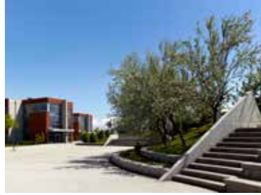
TED Ankara Koleji

Bir yandan bu işin yapılma sırasını anlamaya çalışılırken bir yandan da kısa sürede 44 adet okulun bir anda yapılacak olmasının anlamı sorgulanmıştır. Bu okullar, ülkemiz öğrenci çoğunluğunun eğitim, öğretim gördüğü devlet okulları olması nedeniyle büyük önem arz etmektedir.