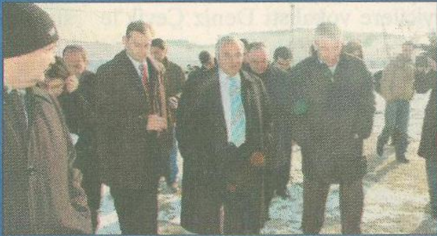
Bakan Atilla Koç, haberdan dolayı Sabah Ankara muhabirlerine çok teşekkür etti.

Bakan Atilla Koç, konser salonunun inşaatını inceledi